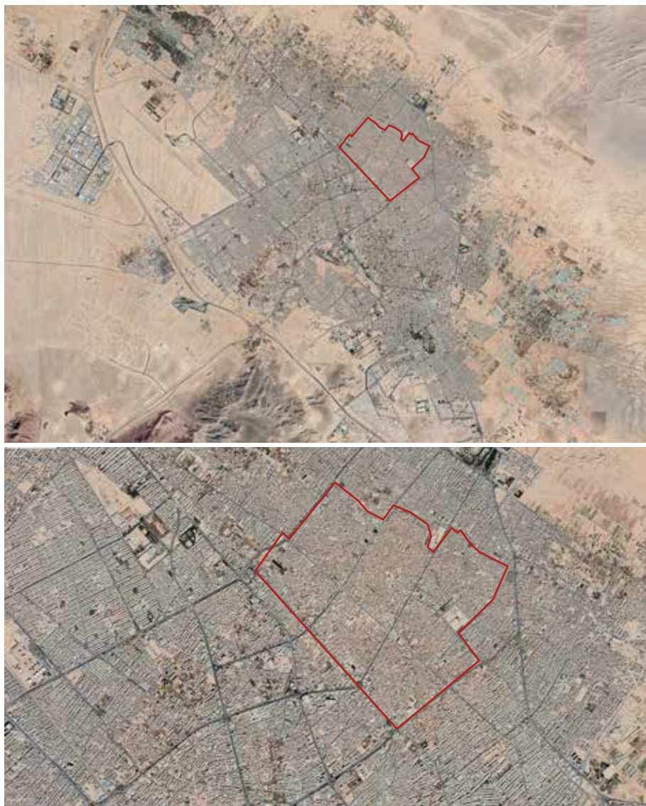
Fig. 5 – Yazd: la città contemporanea (Google Earth Pro, 2020). In evidenza il centro storico.