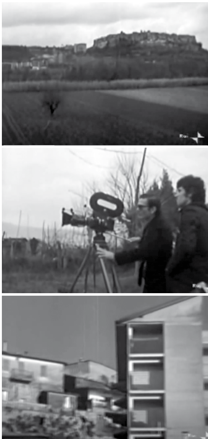
Fig. 1. Immagini estratte dal documentario 'Pasolini e... La forma della Città'; regia di Paolo Brunatto. Le "Teche" della RAI, 1973. In alto. Il profilo della città storica di Orte e la recente edilizia sulla sinistra; al centro Pasolini riprende il profilo di Orte. In basso un dettaglio in cui sono evidenti l'edilizia tradizionale e quella più recente di Orte.